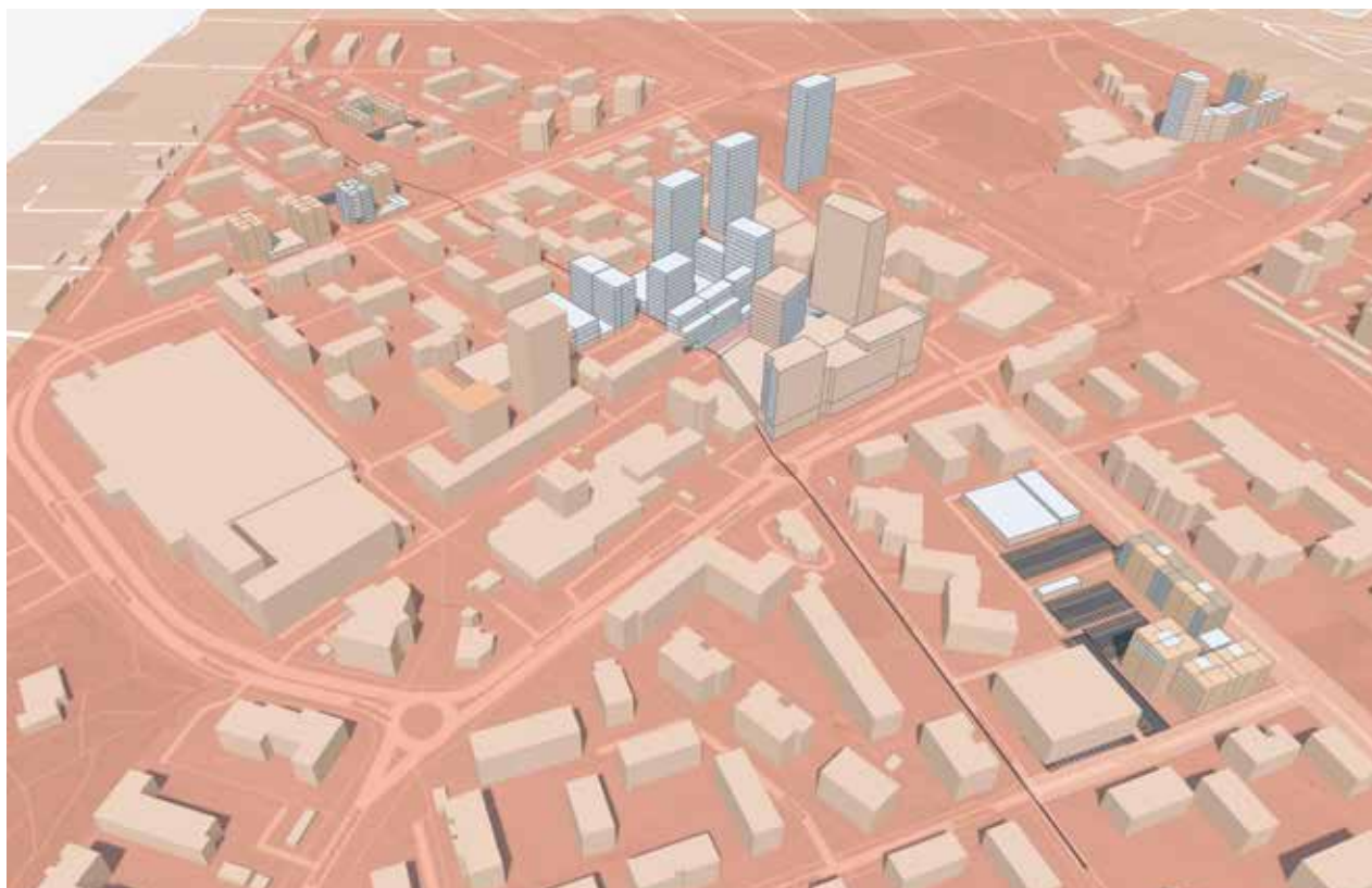
Havainnekuvassa näkyy Järvenpään keskustaa torilta luoteeseen.

'Kehittyvä keskusta' -visiotyön yhteydessä toteutettavassa suunnittelukäsikirjassa keskustan kehittämistä tarkastellaan viiden teemakokonaisuuden kautta, joilla vahvistetaan alueen vireyttä ja viihtyvyttä.