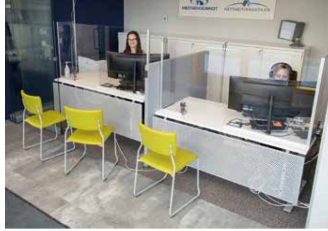
Mestariasuntojen ja Mestaritoiminnan asiakaspalvelu löytyy Järvenpää-infon kanssa samasta aulasta Bulevardikorttelin kolmannelta kerroksesta.

Mestariyhtiöiden asiakaspalveluun mennään Bulevardikorttelin pääsisäänkäynnin kautta ja nouseaan joko hissillä tai rappusten kautta kolmannen kerroksen pihakannelle, josta löytyy asiakaspalvelun sisäänkäynti.