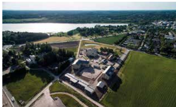
Mestariasuntojen uusi kaukolämpökohde, Verstaspihankuja 8.

Parvekkeitaiteen ja lasit on kohteeseen toimittanut Suomen kiipeilytekniikka, ja yhtiö osallistuu tilanteen selvittämiseen. Myös viranomaisia on informoitu tilanteesta.