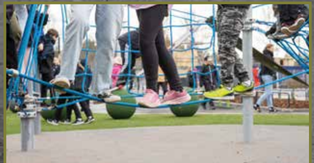
Järvenpään yhteiskoulun eli JYK:n uusi koulurakennus valmistui maaliskuussa ja piha avattiin oppilaiden käyttöön toukokuun alussa. Lapset saivat esittää toiveitaan piha-suunnitelmaan.